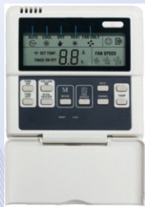
Žičani zidni digitalni kontroler